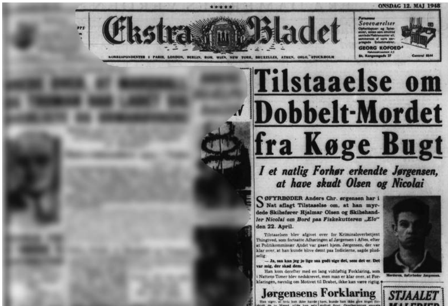
Ekstra Bladets forside 12. maj 1948.